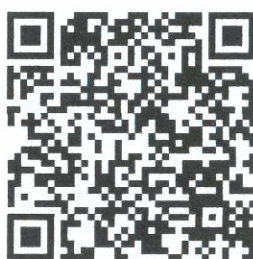
แนวทางการขับเคลื่อนฯ

กลุ่มงานสารสนเทศการพัฒนาชุมชน สำนักงานพัฒนาชุมชนจังหวัด โทร./โทรสาร ๐ ๔๒๑๑ ๔๘๒